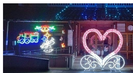
⑧ 宮町地区内: 八鹿ふれあい倶楽部