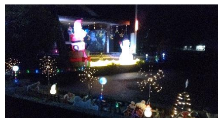
⑤ 小山地区内: 朝倉橋の小山側