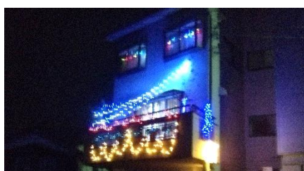
⑦ 京口地区内: 中川ビル横(川側)