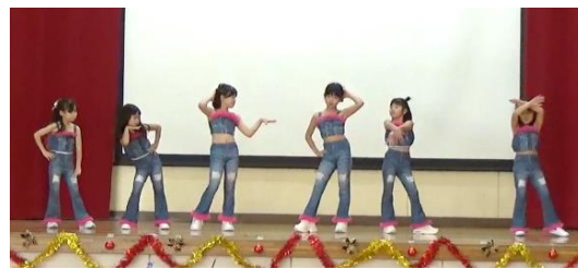
バンビクイーンエイト