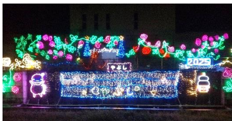
① 駅前地区内: 八鹿駅ホームの向い

今年も、12月9日から「まちなかイルミネーション」～みんなで街灯りを楽しもう～ が始まりました!! 普段あまり通らない場所にもイルミネーションが設置されています。冬の夜空に輝くイルミネーションの光を眺め、クリスマスムードを楽しんでみてはいかがでしょうか。(点灯は12月25日まで)