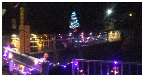
⑥ 朝倉地区内: 朝倉農業倉庫周辺