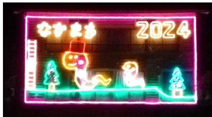
③ 仲町地区内: 仲町公会堂八木川側