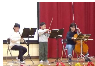
愛先生プロデュース アラセイズ