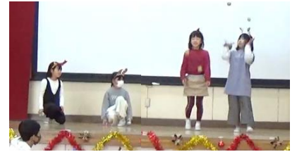
しゃぼん玉グループ