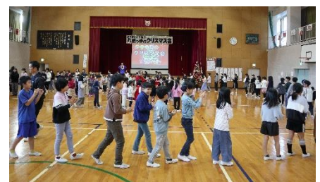
みんなで輪になって「八鹿音頭」