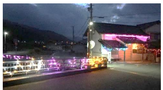
昨年度イルミネーション（朝倉区）