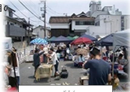
くらわんか五六市の風景