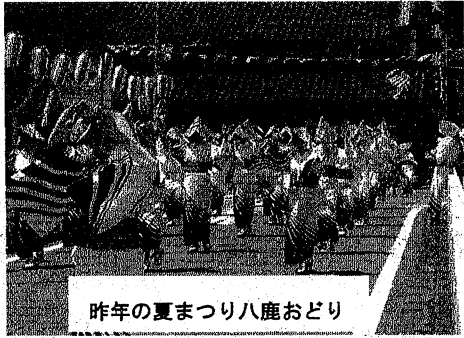
昨年の夏まつり八鹿おどり

但馬の夏まつりのトップを飾って開催される八鹿夏まつりは、7月14日(土)15日(日)に開催することが、3月26日(月)に開催された第1回八鹿夏まつり実行委員会で決定されました。