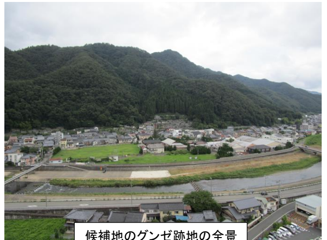
候補地のグンゼ跡地の全景