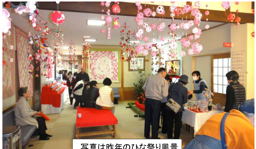
写真は昨年のひな祭り風景