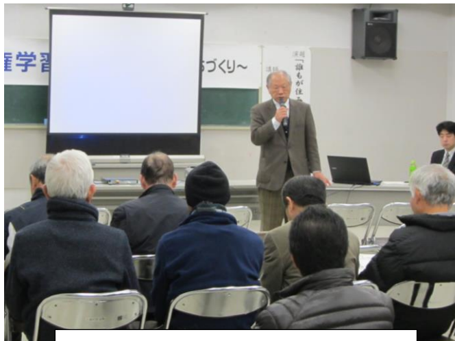
養父市人権協議会八鹿支部長のあいさつ