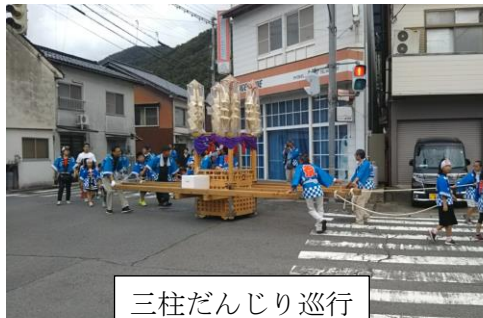
三柱だんじり巡行