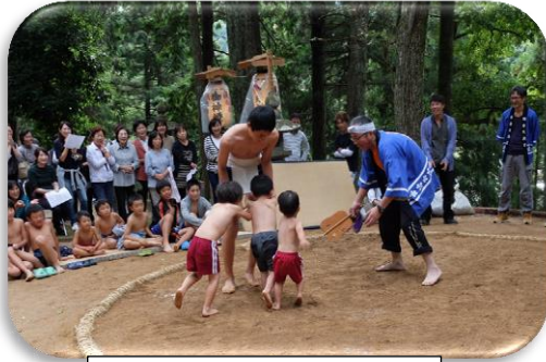
朝倉区こども奉納相撲

子どもだんじりの巡行を行うところも多いのですが、子どもの数の減少に頭を痛めているようです。各地で行われた秋祭りの一コマをお知らせします。