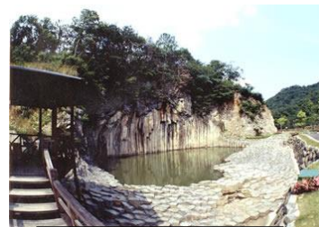
やくの玄武岩公園

10月例会を18日(水)に行います。参加費は3000円です。市役所前を8:50に出発。13:50に帰宅予定です