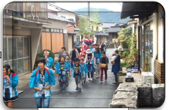
大森区のだんじり巡行