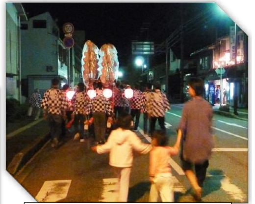
駅前区の夜に回るだんじり巡行