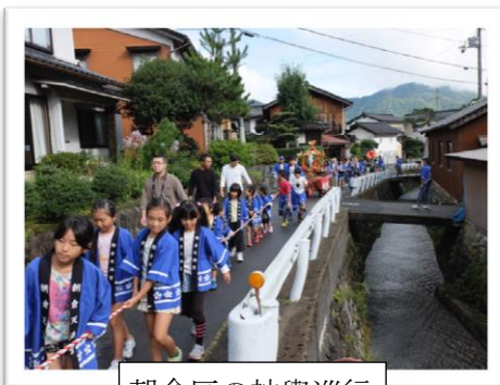
朝倉区の神輿巡行