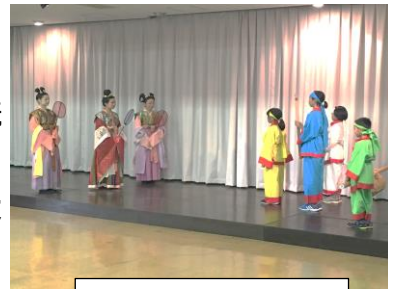
昨年の赤米奉納式

八鹿小学校では、平城京から発掘された木簡により赤米を昨年より平城京に奉納しています。既に2回の実行委員会を行いました。今年は10月20日(金)に市役所で7:10から出発式を行います。市民のみなさんの激励をお願いします。