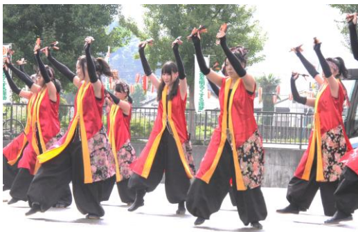
パフォーマンス大会。 近畿大学のよさこいおどり