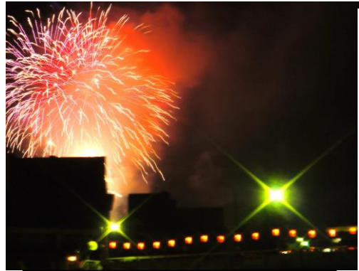
豪華 1700 発の打ち上げ花火