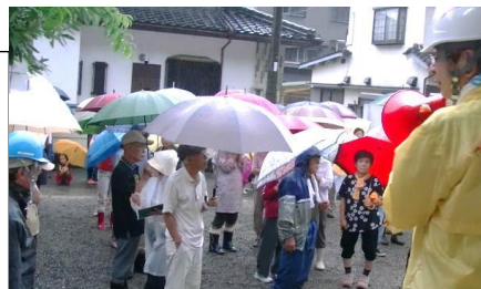
諏訪町区の訓練風景

9月1日(日)午前10時告知放送を合図に市内全域で避難訓練が行われました。当日はあいにくの雨のため中止となった区もありましたが