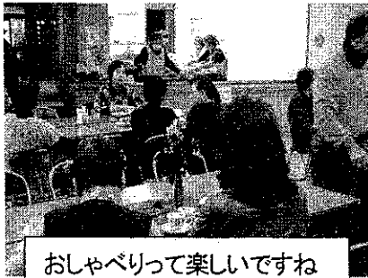
おしゃべりって楽しいですね

ふれあい倶楽部では、毎月第1土曜日(1月は第3土曜日)に土曜ふれあい喫茶が開かれています。