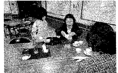
ボランティアのお孫さんがお手伝い。上手でしたよ。

ふれあい喫茶が開店する時は ふれあいネットの有線放送でお知らせしています。お友達と一緒にお気軽にご参加ください。