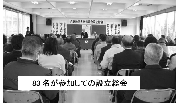
83 名が参加しての設立総会