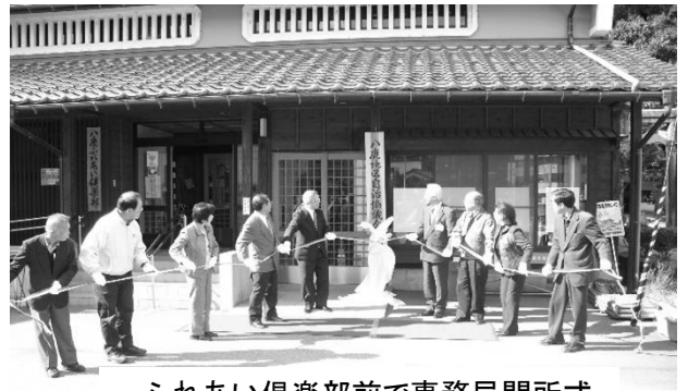
ふれあい倶楽部前で事務局開所式