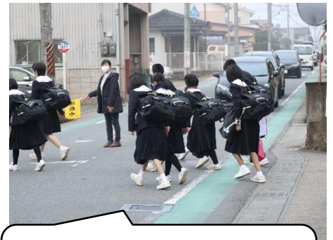
下車後、ここでも、道路横断に見守りで生徒の安全を確保します。ご苦労さまです。