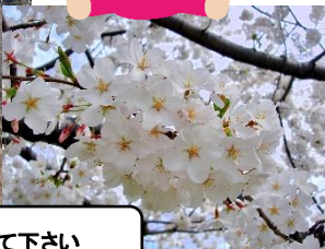
岡区 小佐川上流から 桜満開をイメージして見て下さい