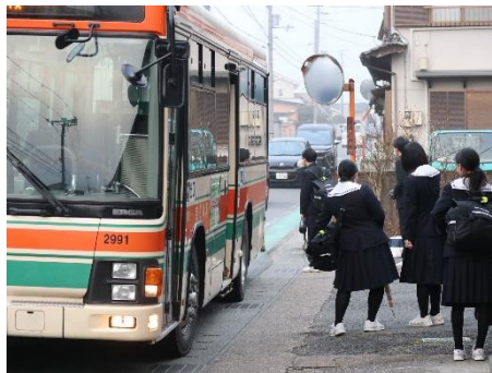
小佐からは路線バスで通学です。