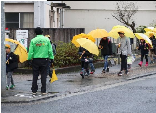
小学生が集団登校。 「おはよう。」「行ってらっしゃい。」「あいさつから見守り。」