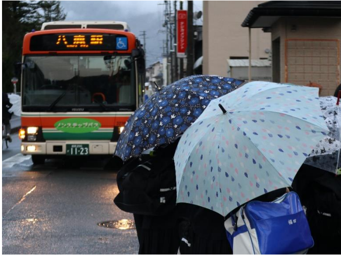
高柳八木からは路線バスで通学です。

栄町、小佐口の朝、小学生、中学生、高校生が登校、町が賑やかです、「さあ一日が始まる。」子ども達の気持ちが伝わって来ます。中学校は伊佐宿南など遠くからの通学にスクールバスが運行されています、八鹿地区も上網場区はスクールバスを利用します。路線バスも利用します。