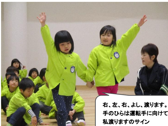
右、左、右、よし、渡ります。 手のひらは運転手に向けて私渡りませうのサイン