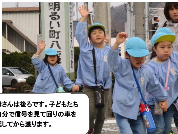
保母さんは後ろです。子どもたちが自分で信号を見て回りの車を確認してから渡ります。