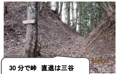
30分で峠 直進は三谷 カンス岩は左尾根です