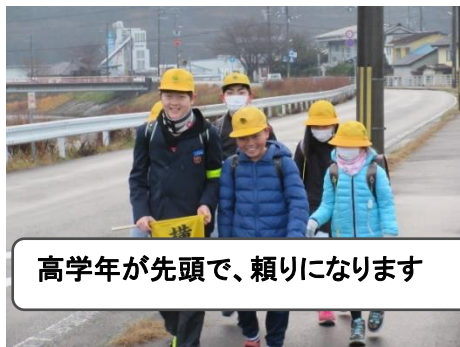
高学年が先頭で、頼りになります

意外に私たちの住んでいる風景に気づかないことが多くあります。 朝、子どもたち、八鹿駅改札を抜けて高校生が歩いて高校に向かいます。高校前は両親に送ってもらう車で混雑気味。小学生は集団登校で、6年生、5年生が先頭で低学年を見守りながら通学します。