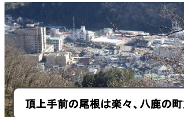
頂上手前の尾根は楽々、八鹿の町並みが望めます。