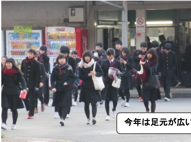
今年は足元が広い