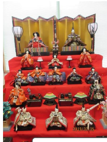
やっぷーも待ってます

八鹿ふれあい倶楽部に春らしくおひなさまの飾りつけをしました。お友達ご家族で気軽に足を運んで下さい。これまで、八鹿ふれあい倶楽部で「手づくりひな祭り」を開催しておりましたが、今年から見直しました。手づくりひな祭りはお休みです。