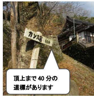
頂上まで40分の 道標があります