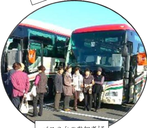
バス2台の参加者に