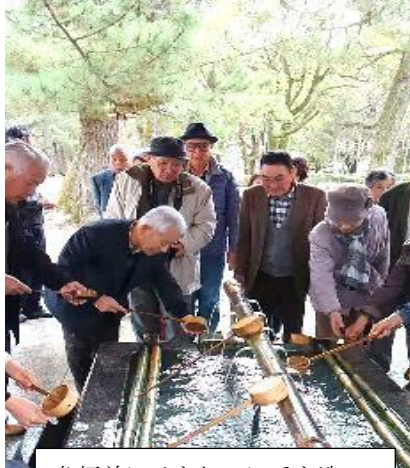
参拝前にはきれいに手を洗って