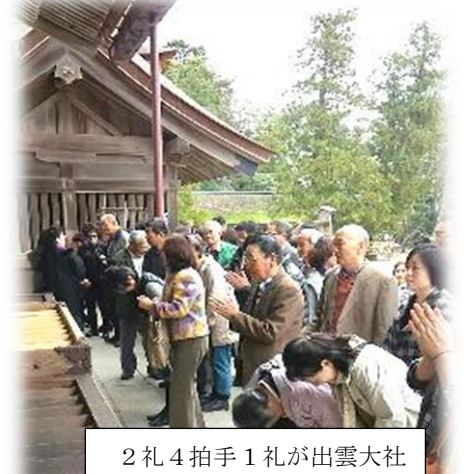
2礼4拍手1礼が出雲大社