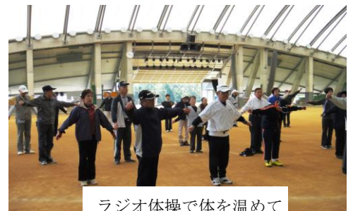
ラジオ体操で体を温めて