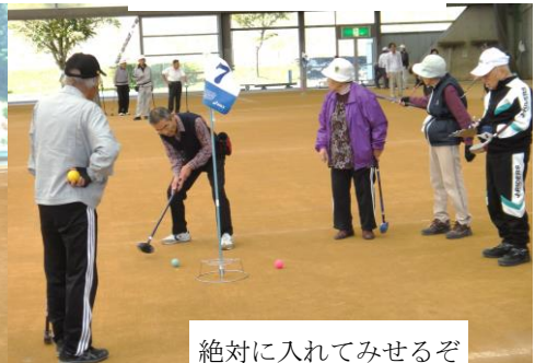
絶対に入れてみせるぞ