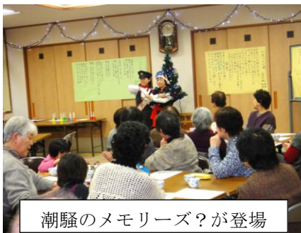
潮騒のメモリーズ?が登場

12月のふれあい喫茶が21日の土曜日に開店しました。今回はクリスマス喫茶ということで、ハンドベルやキーボードそして連続TVあまちゃんで有名になった「潮騒のメモリーズ」