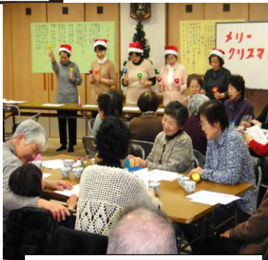
ハンドベルで皆で合唱

参加者は、楽しく歌い、語らい、素敵なクリスマス喫茶となりました。巡回するふれあいバスも「回ってもらったら遠慮せんと乗れる」と好評でした。