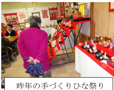
昨年の手づくりひな祭り